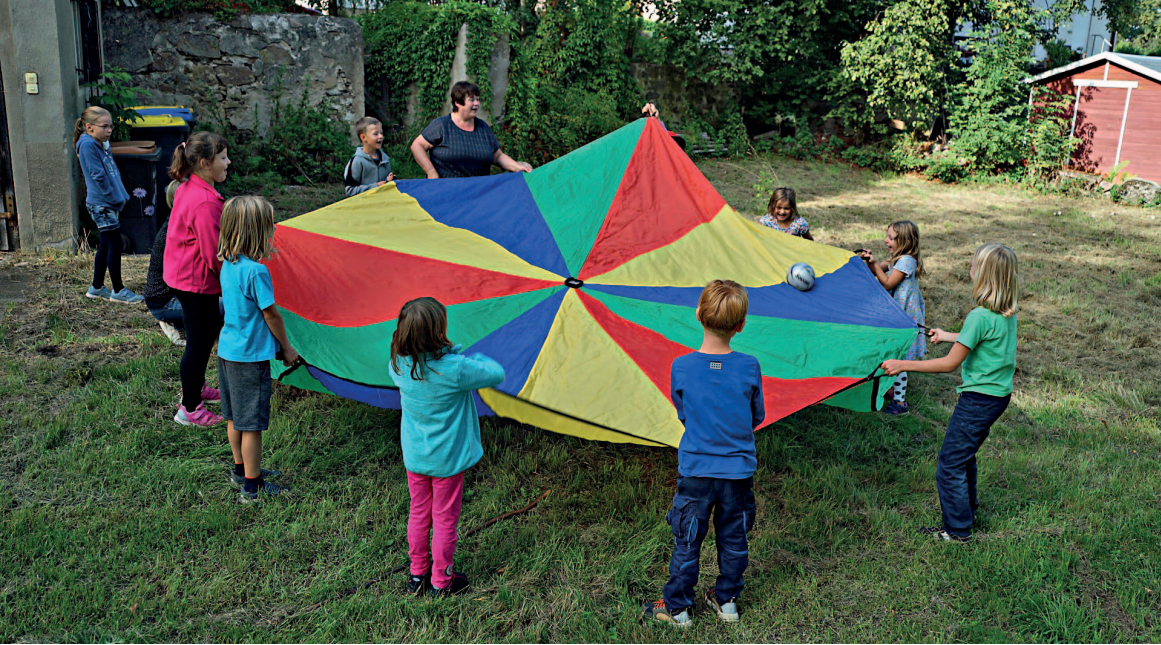
Schulanfang in Krögis

←Titel: Altar der St. Marien-Kirche zu Schildau aus dem 15. Jh.