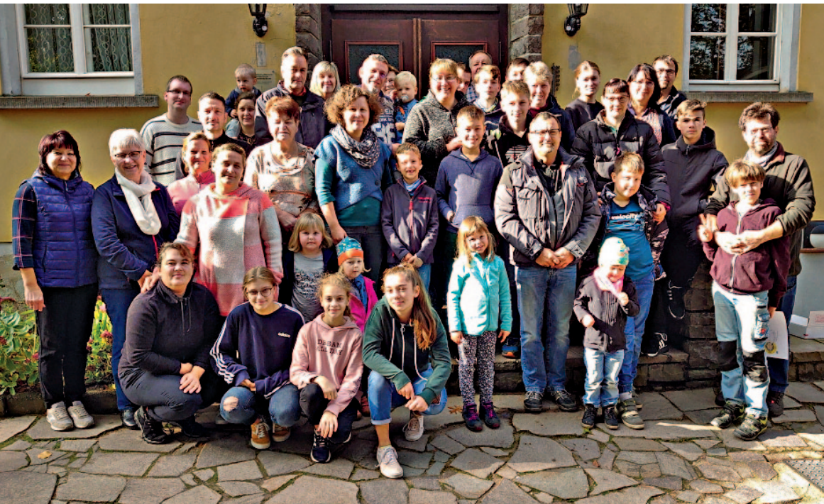
Gemeinderüstzeit in Schmannewitz

←Titel: Altar der St. Marien-Kirche zu Schildau aus dem 15. Jh.