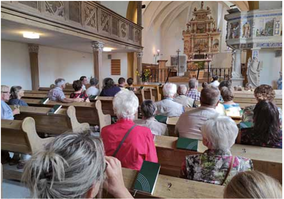
Orgel & Wein in der Kirche Taubenheim