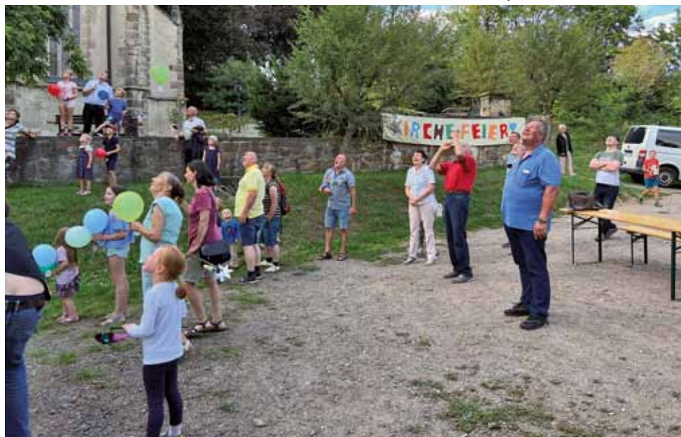
Gemeindefest in Burkhardswalde