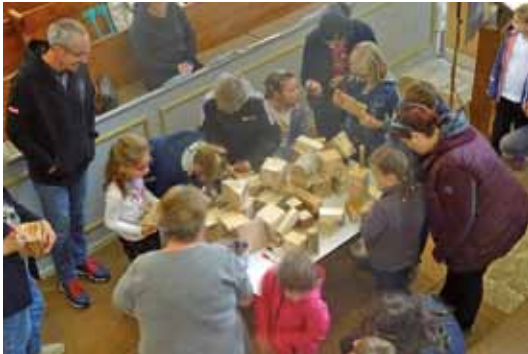
Gemeindefest in Miltitz