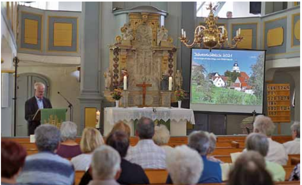
Titelfoto: Gemeindefest Burkhardswalde