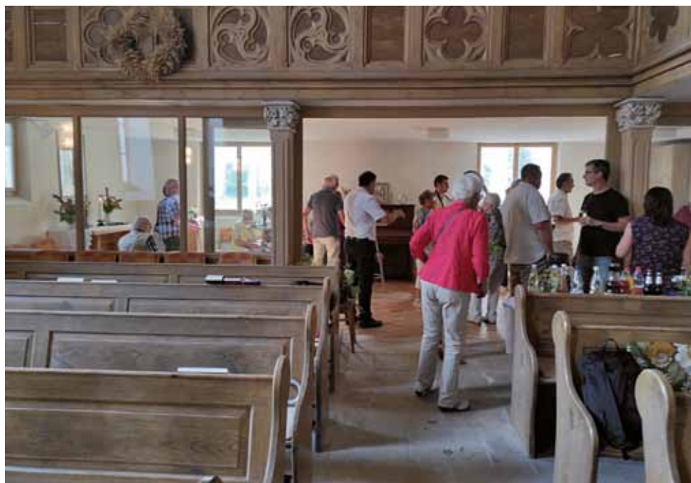
Einweihung der Gemeinderäume in der Kirche Taubenheim