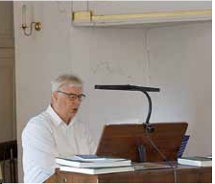
Gottesdienst in Heynitz