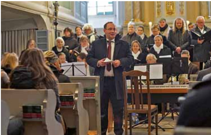
Adventskonzert in Siebenlehn