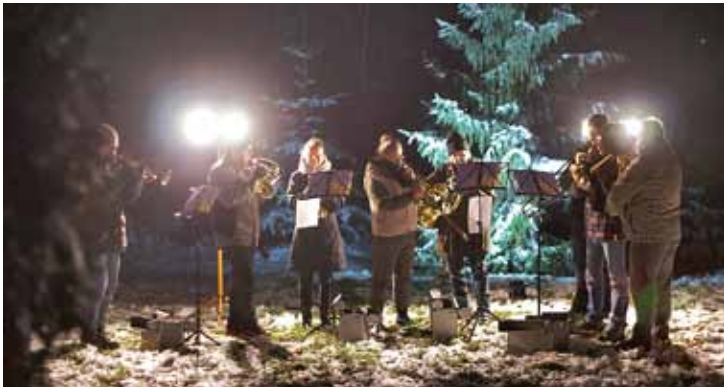
Posaunenchor im Advent in Krögis