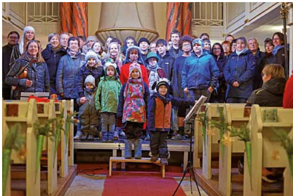
Krippenspiel in Heynitz