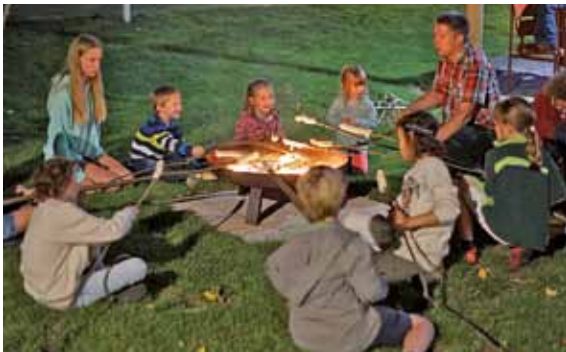
Zur Rüstzeit in Schmiedeberg