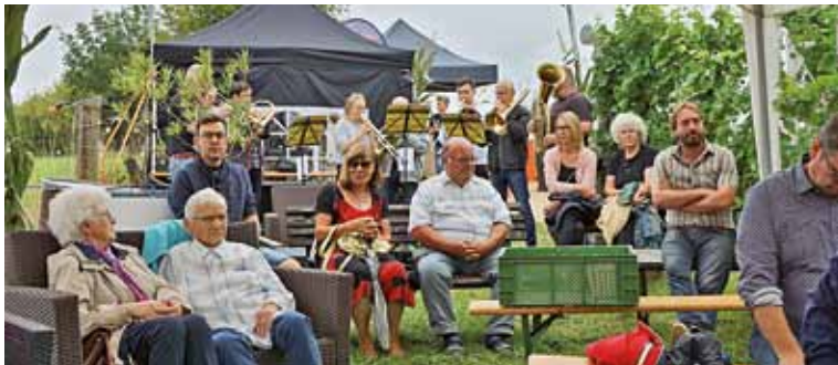
Gottesdienst im Weinberg Mauna