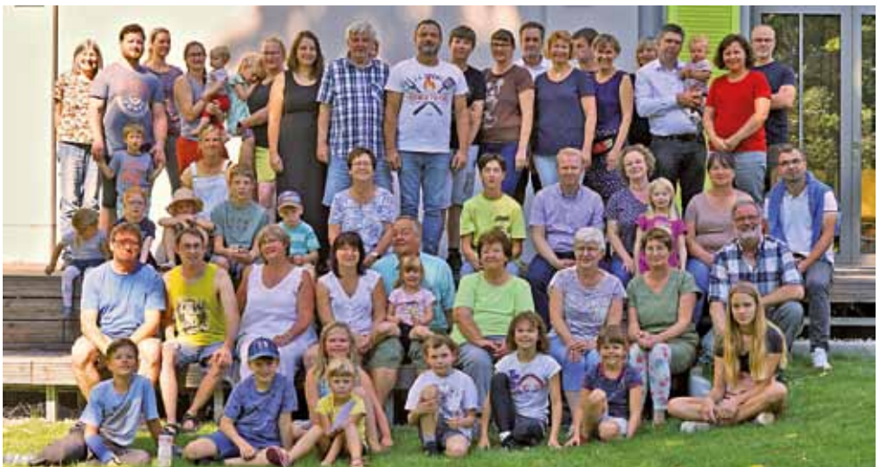
Titelbild: Kapelle des Winfriedhauses in Schmiedeberg, Foto: Fam. Oertel