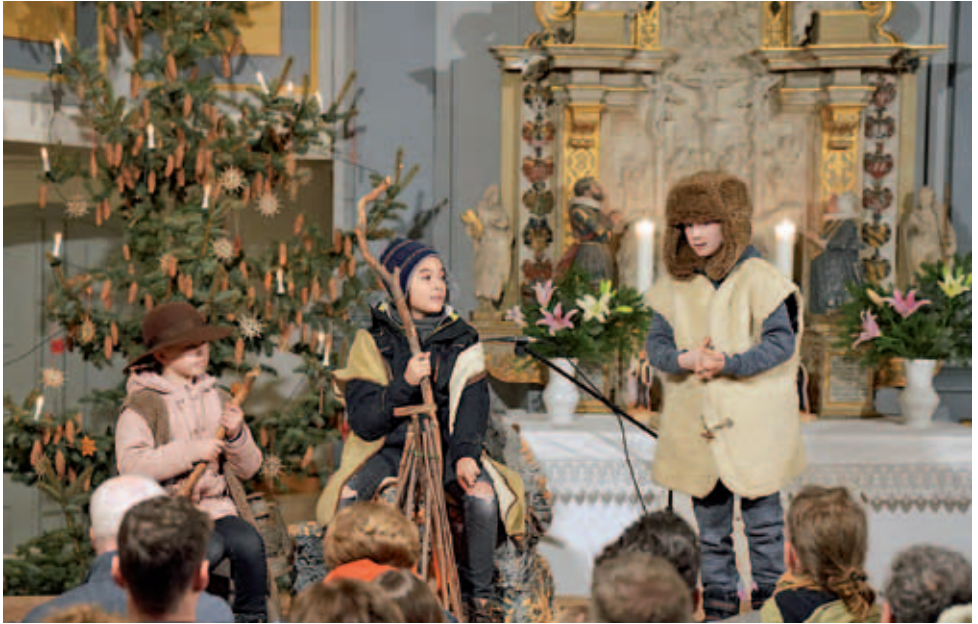
Krippenspiel in der Kirche Miltitz