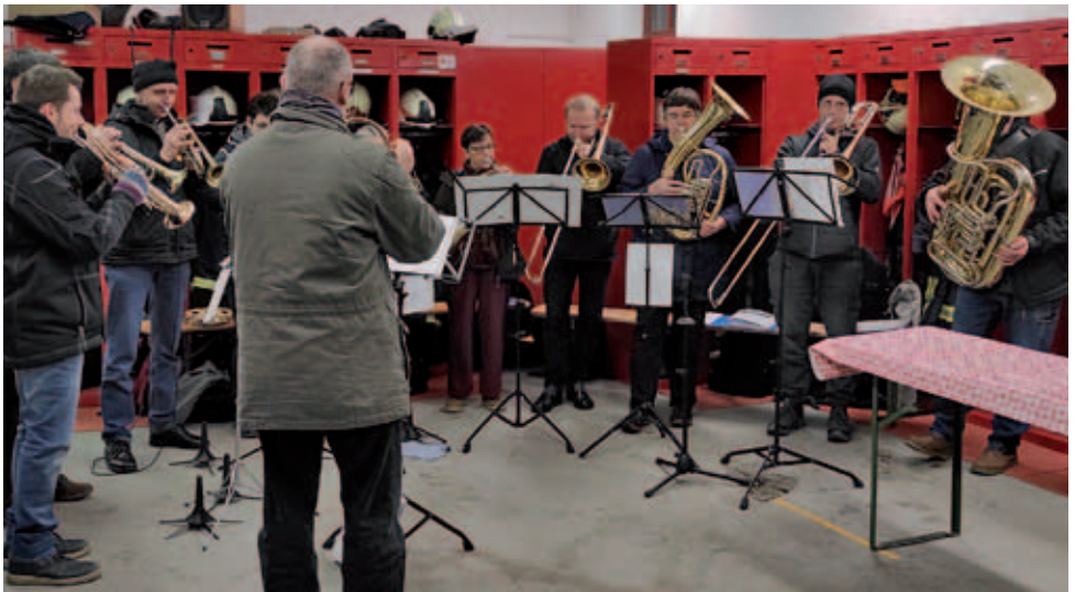
Der Posaunenchor bei der Freiwilligen Feuerwehr Burkhardswalde