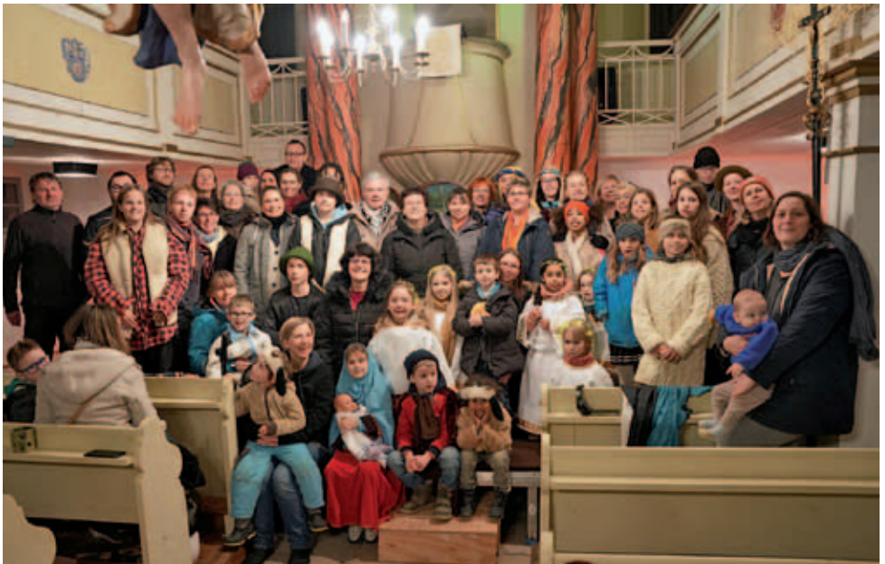
Krippenspieler in der Kirche Heynitz