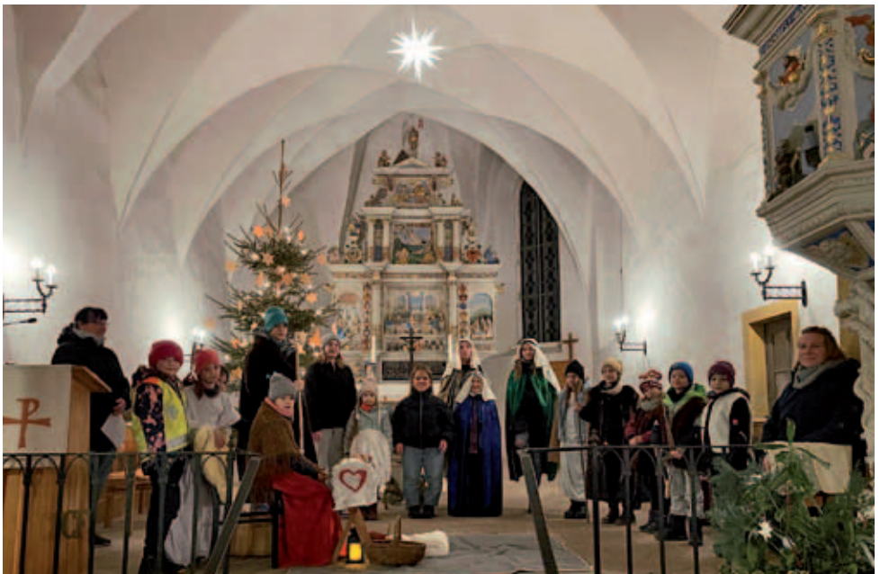
Krippenspiel in der Kirche Taubenheim