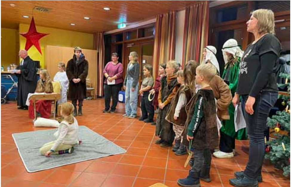
Krippenspiel im AWO Pflegeheim Taubenheim