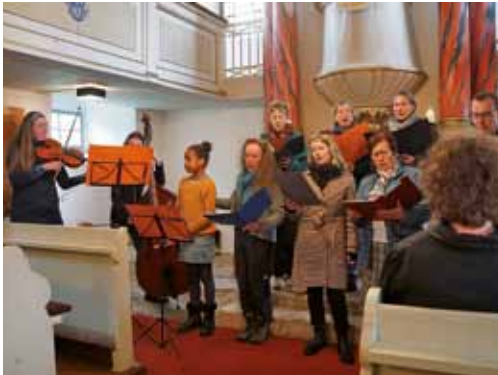
Ostergottesdienst in Heynitz