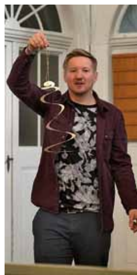
Pfingsten in Krögis