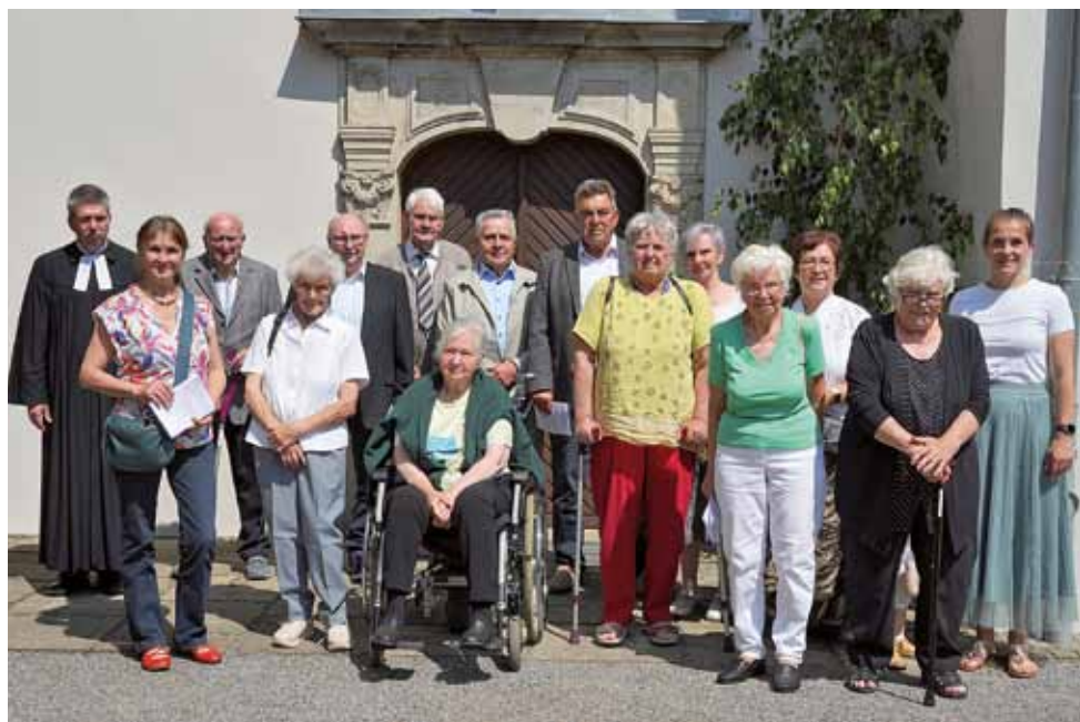
Jubelkonfirmation in Heynitz