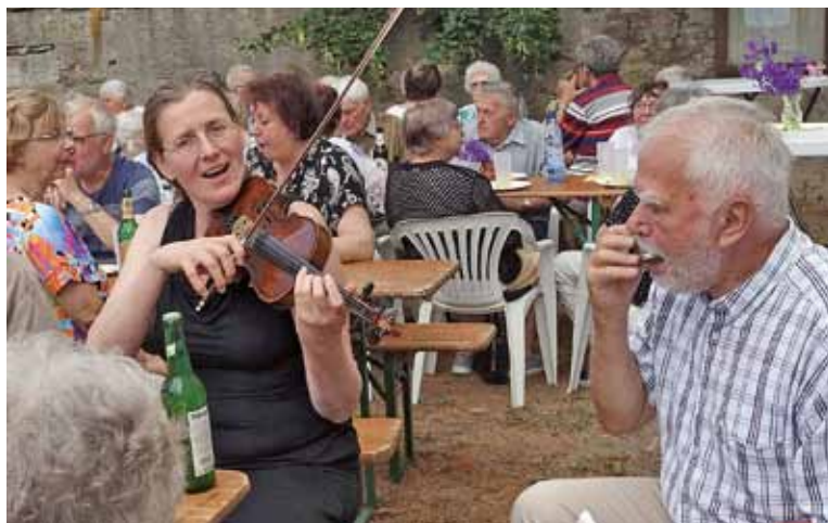
Johannisfeier in Heynitz