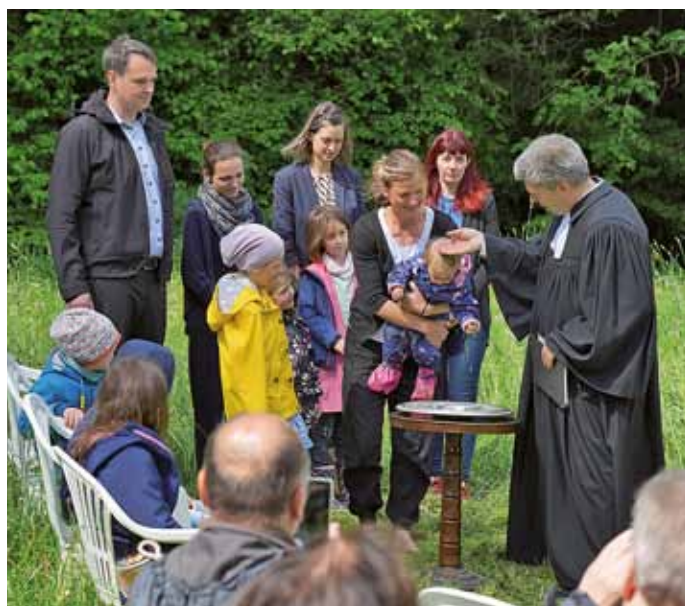
Taufe zu Himmelfahrt am Rothschnöberger Stolln