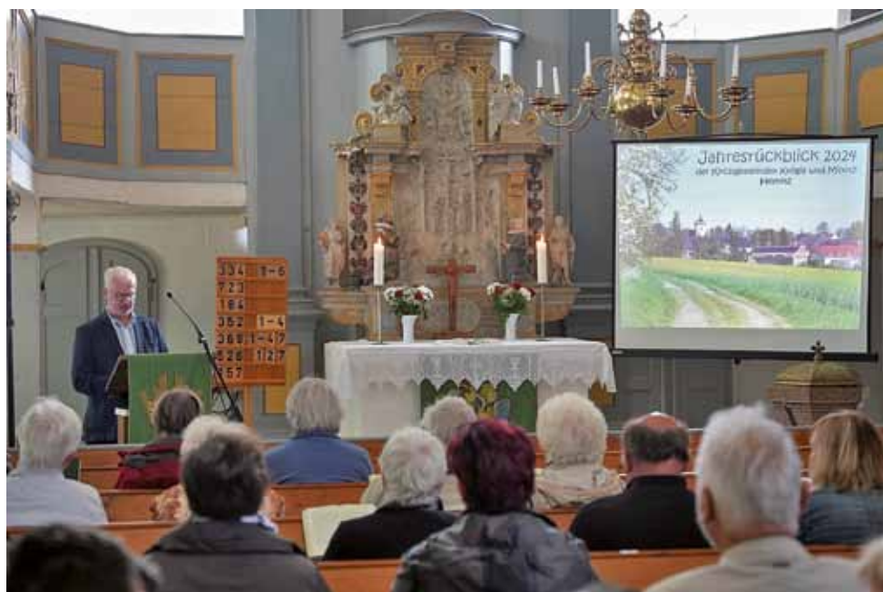
Jahresrückblick Miltitz