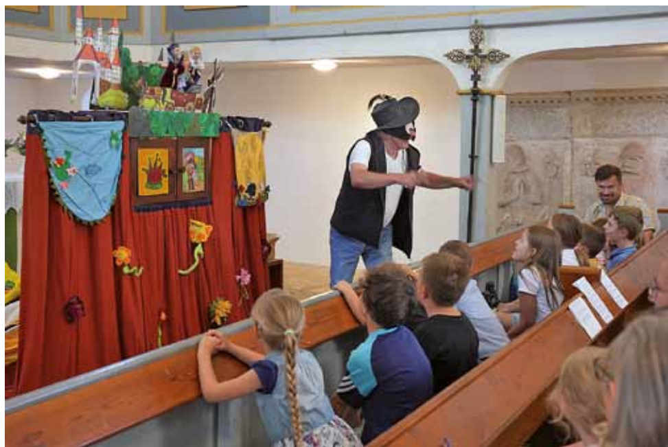
Gemeindefest Miltitz