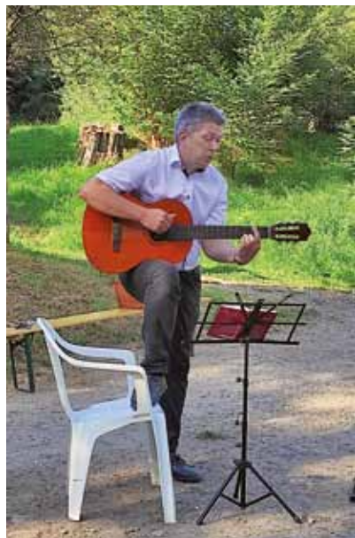
Gemeindefest Burkhardswalde